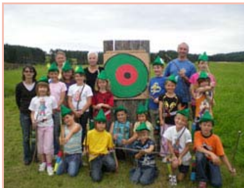
bitte das Bild zum vergrößern anklicken