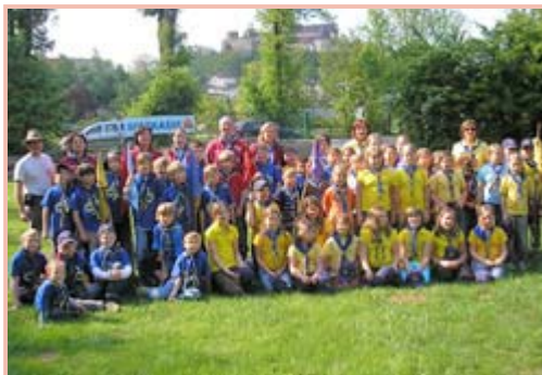
bitte das Bild zum vergrößern anklicken

Unter dem Motto „Sinnlos“ mussten sich die Kinder bei den Stationen unter 34 anderen Ringen und Rudeln bewähren.